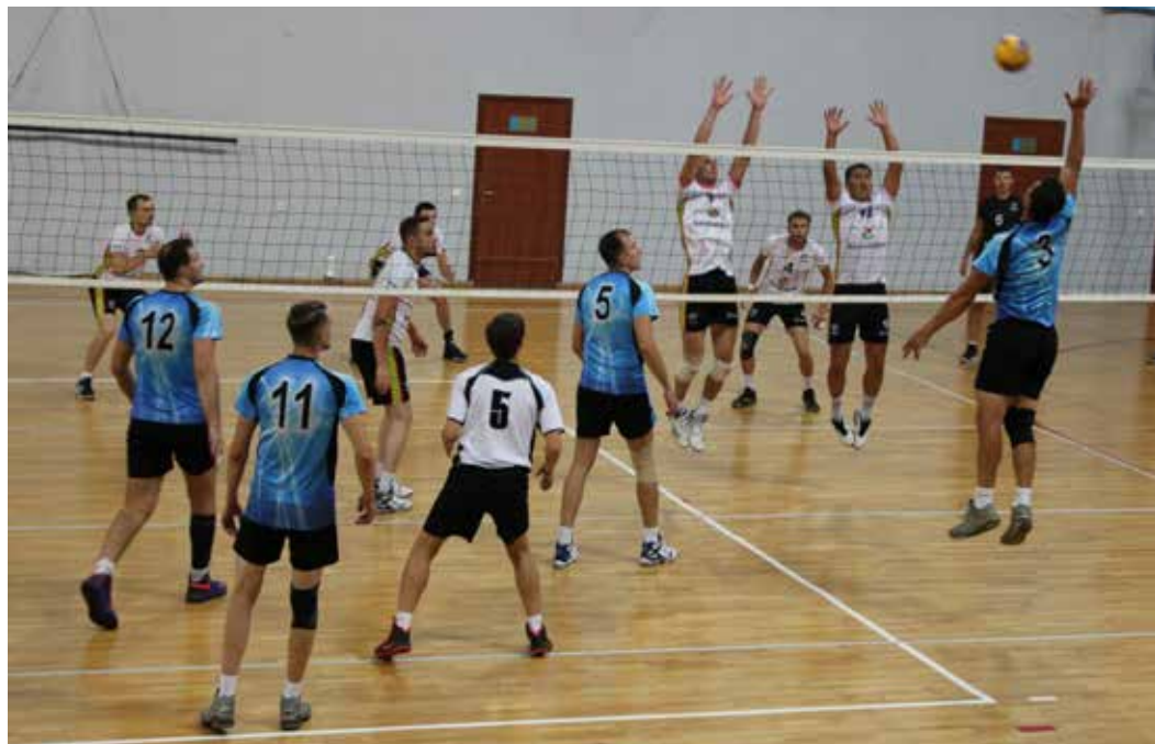
Волейбольная команда Общества