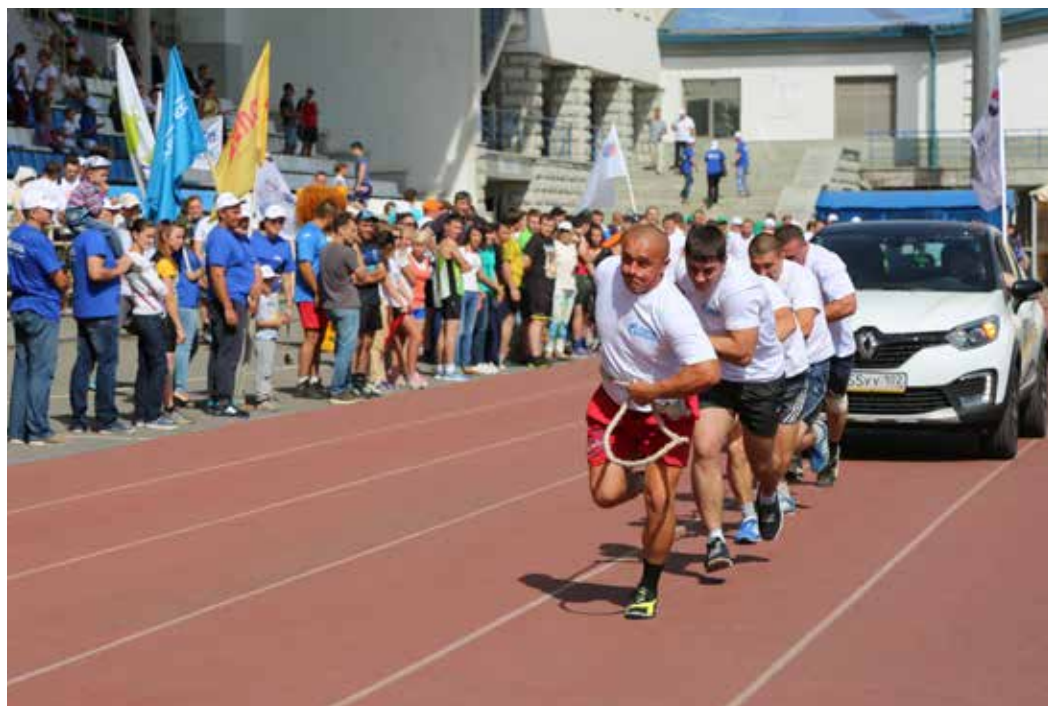
Состязания по перетягиванию автомобиля