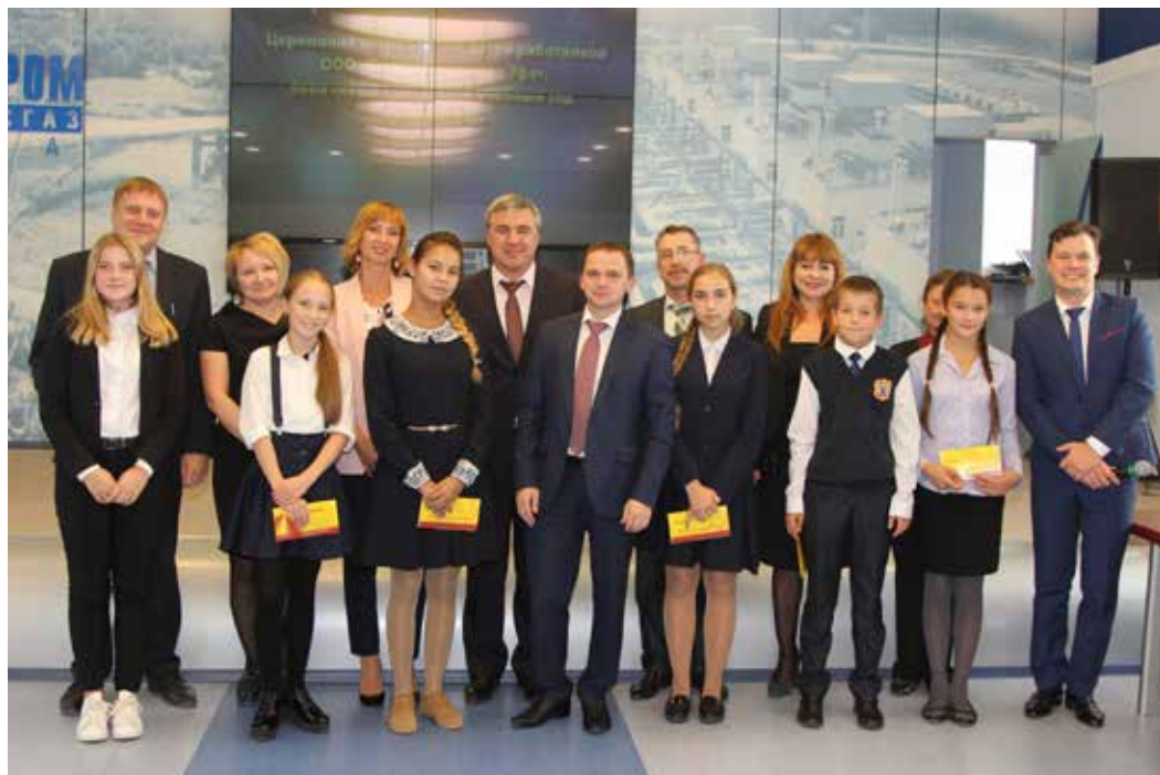
Церемония награждения отличников учебы стала доброй традицией