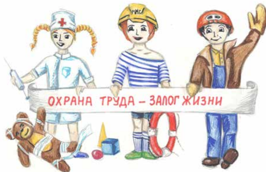
Рисунок Антона Дуракова (Сибайское ЛТУ УС В. Авзян)

Беседовала Виктория ВАВИЛОВА.