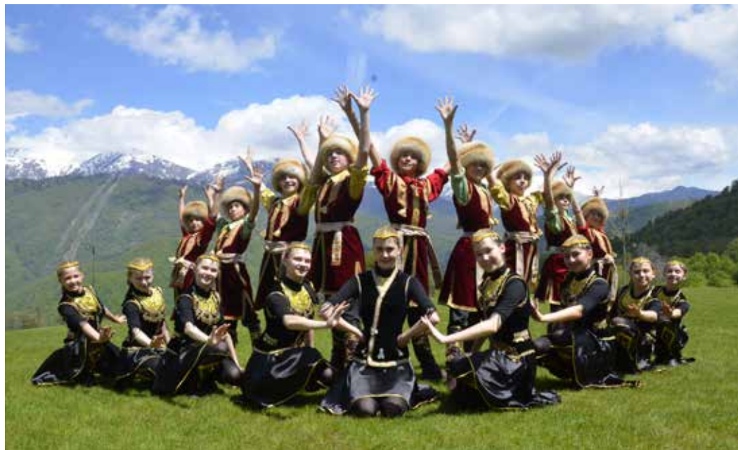
Ансамбль народного танца «Далан»

Следите за новостями фестиваля! http://www.gazpromfakel.ru vk.com/fakel-ufa2016 instagram.com/fakel-ufa2016 хэштег: #fakel-ufa2016