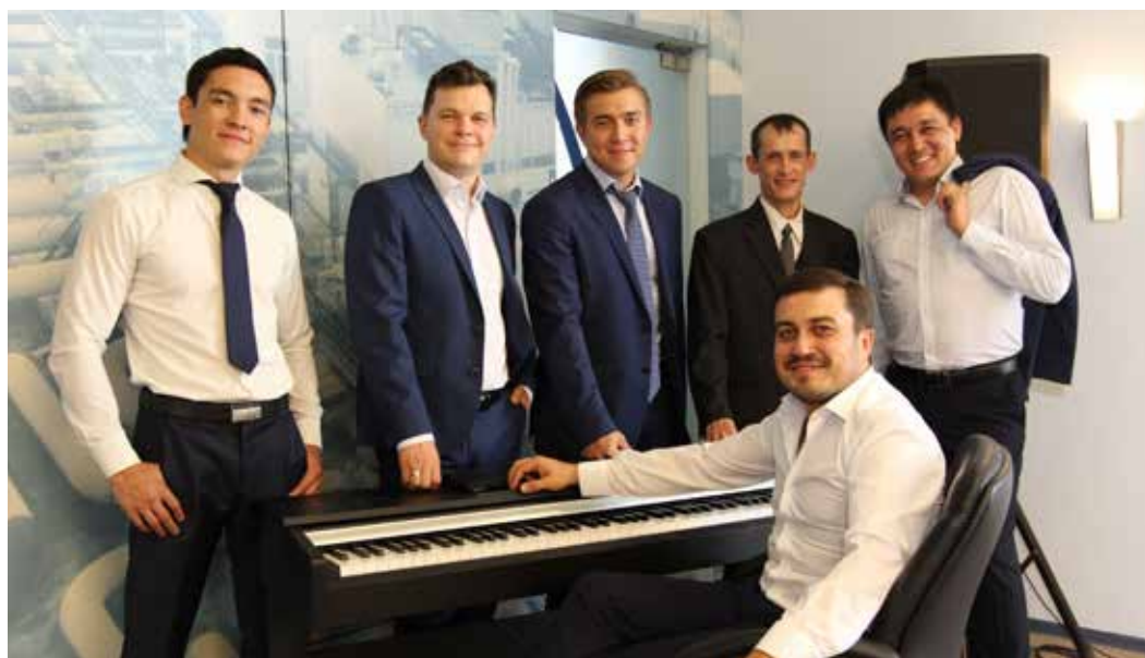
Вокальный ансамбль «Премьер»