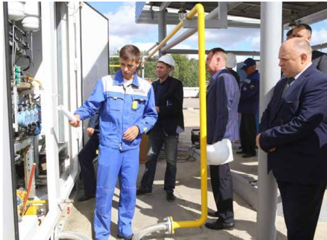
Во время осмотра комиссией компактной модульной АГНКС производства ЗАО «Барренс»