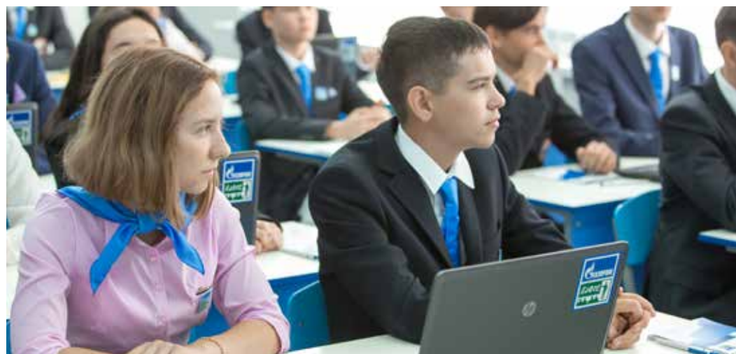
К учебе готовы!