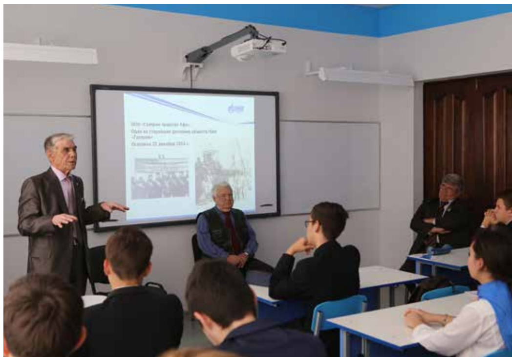
Во время классного часа

Поддержка ветеранов на предприятии не ограничивается одним днем. Забота о них ведется в «Газпром трансгаз Уфа» постоянно и всесторонне, включая регулярную материальную поддержку, качественное медицинское обслуживание и организацию семейного отдыха.