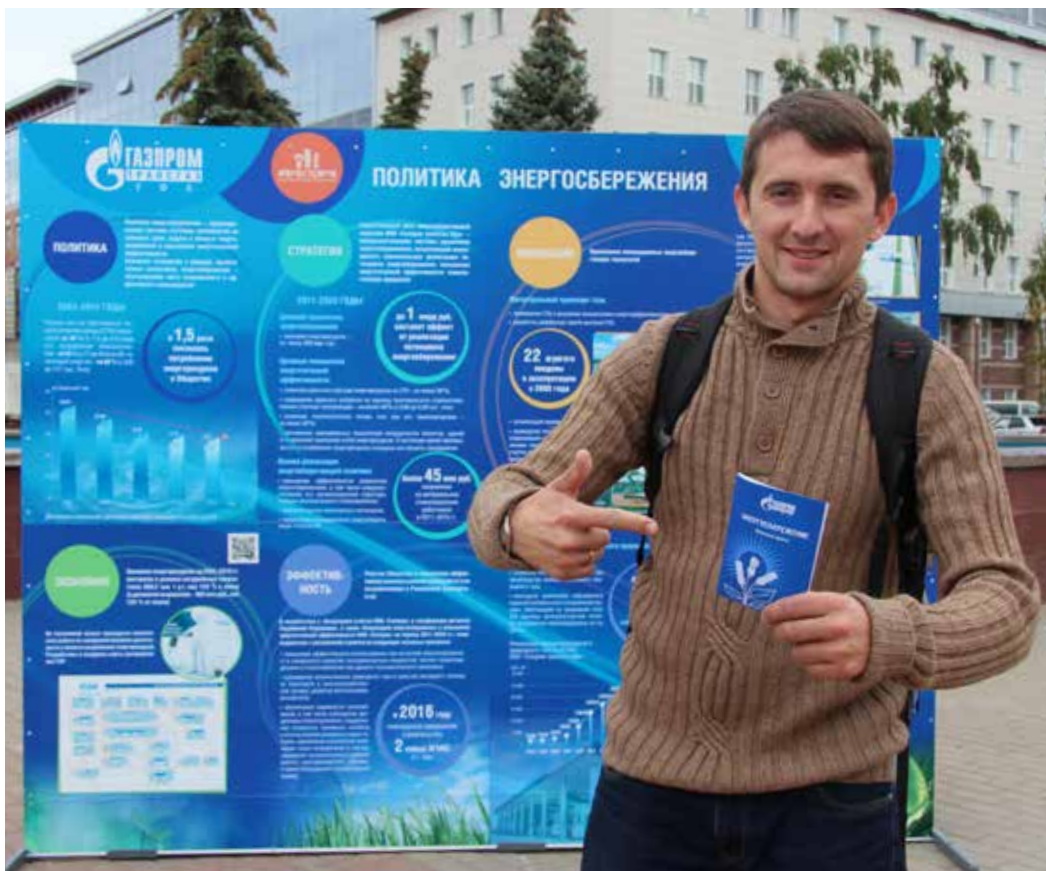
Презентация Общества по энергоэффективным технологиям

ООО «Газпром трансгаз Уфа» приняло участие во Всероссийском фестивале по энергосбережению, очередной этап которого прошел 3 сентября в Уфе.