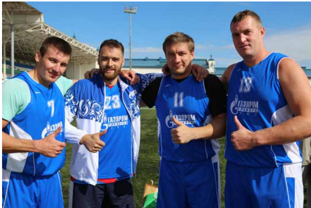
Баскетбольная команда Общества готова к бою!