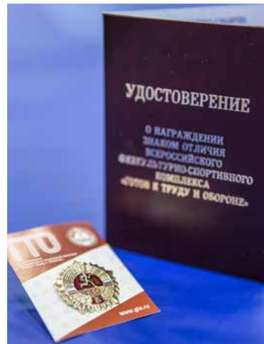
Удостоверение и значок ГТО, за которые борются газотранспортники