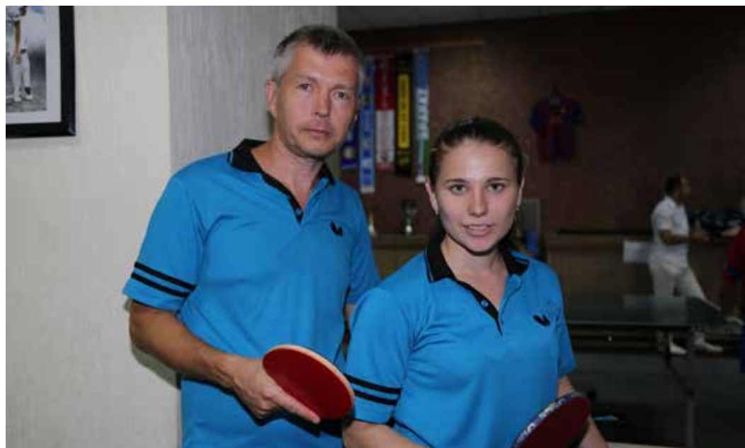
И в настольном теннисе работники Общества – среди лучших