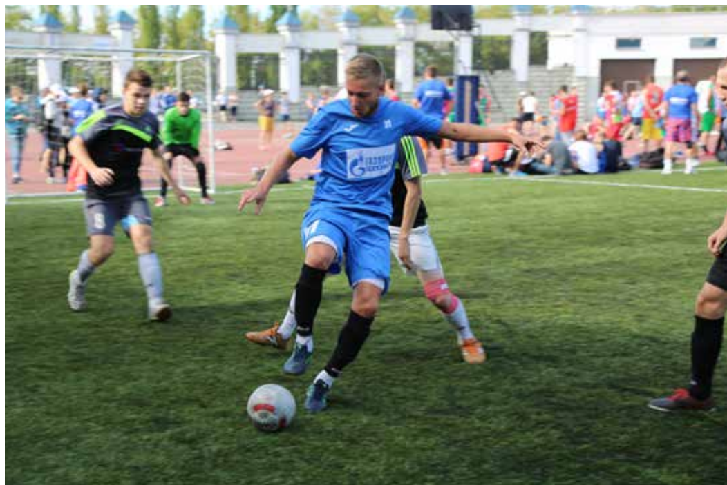
Футболисты Общества на поле