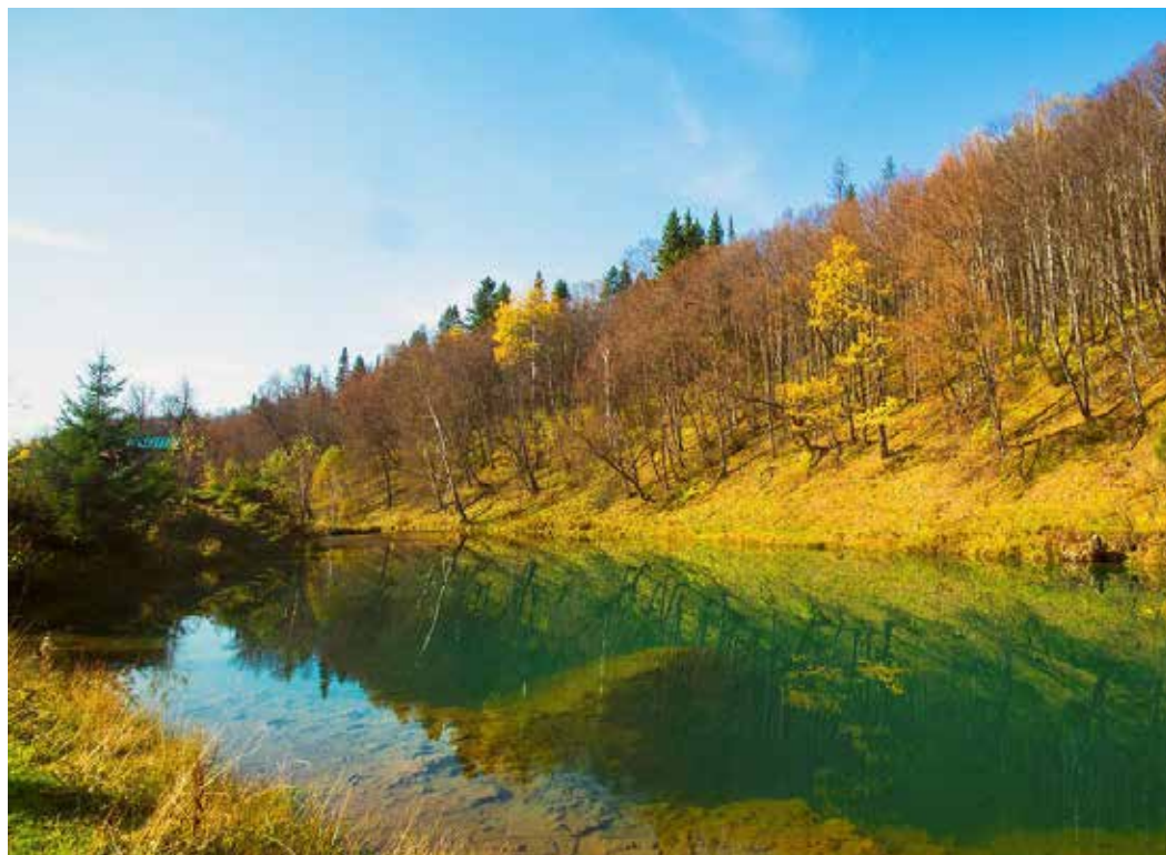
Алик Хайдаров (ИТЦ) «Озеро-родник Сарва»