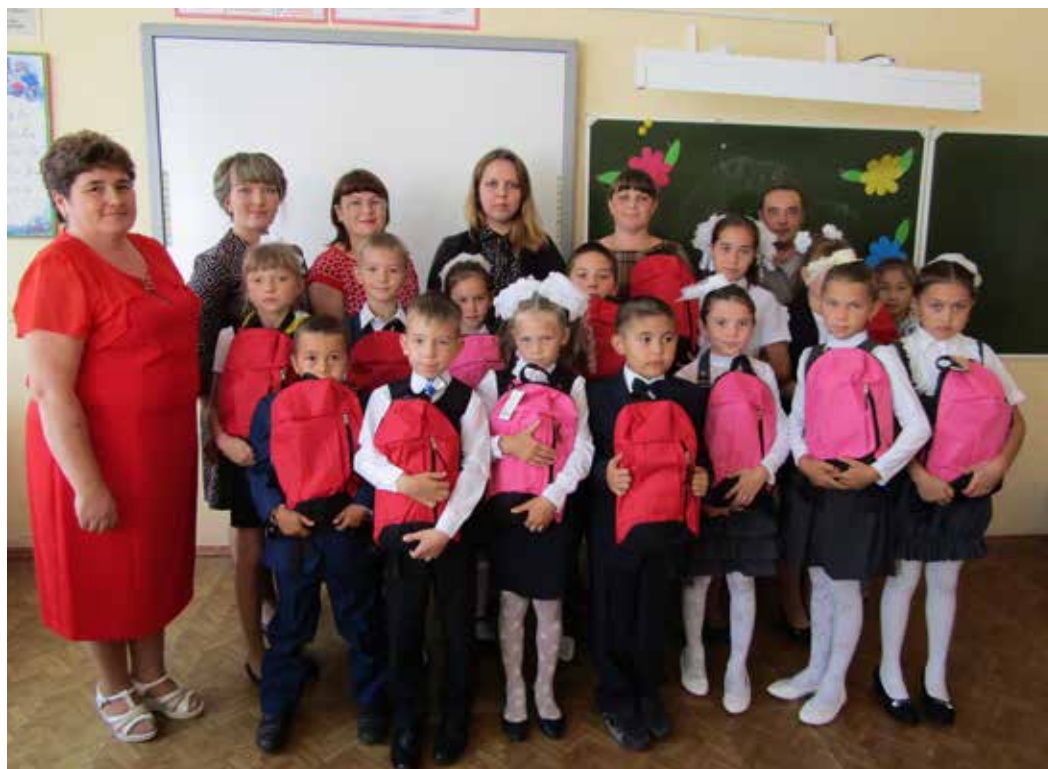
Полянское ЛПУМГ – лидер акции

Ольга ЗУБАЧЕВСКАЯ.