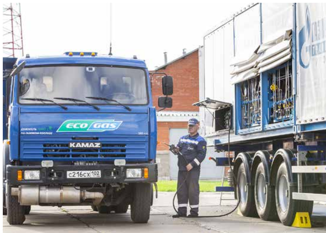
Чем выше давление в баллонах, тем быстрее идет заправка