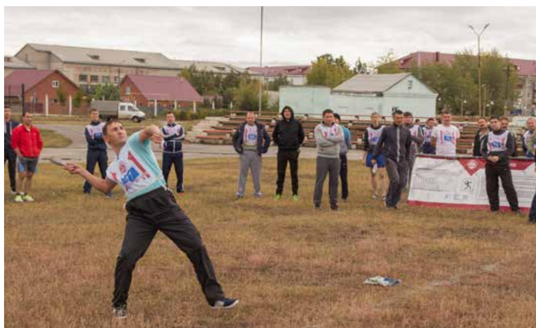
Нормы ГТО выполняют в Сибайском ЛПУМГ