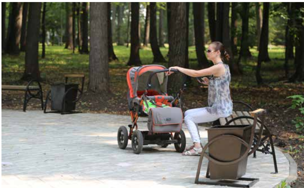
После благоустройства парковая зона стала оазисом комфортного времяпрепровождения горожан

Вопросам благоустройства городских пространств в столичном муниципалитете уделяется особое внимание. Некоторые из уфимских предприятий прислушиваются к при-