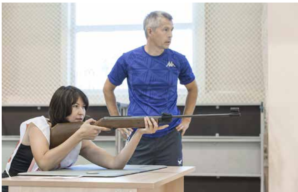
И мужчины, и женщины соревновались в стрельбе...