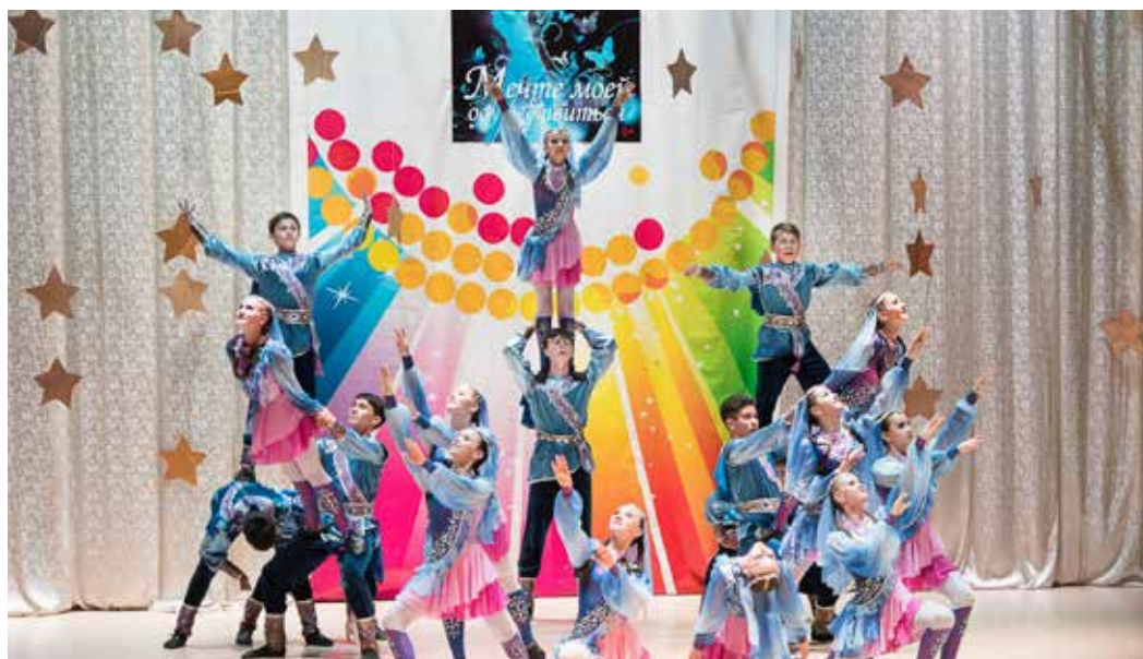
Ансамбль эстрадно-спортивного танца «Виктория»