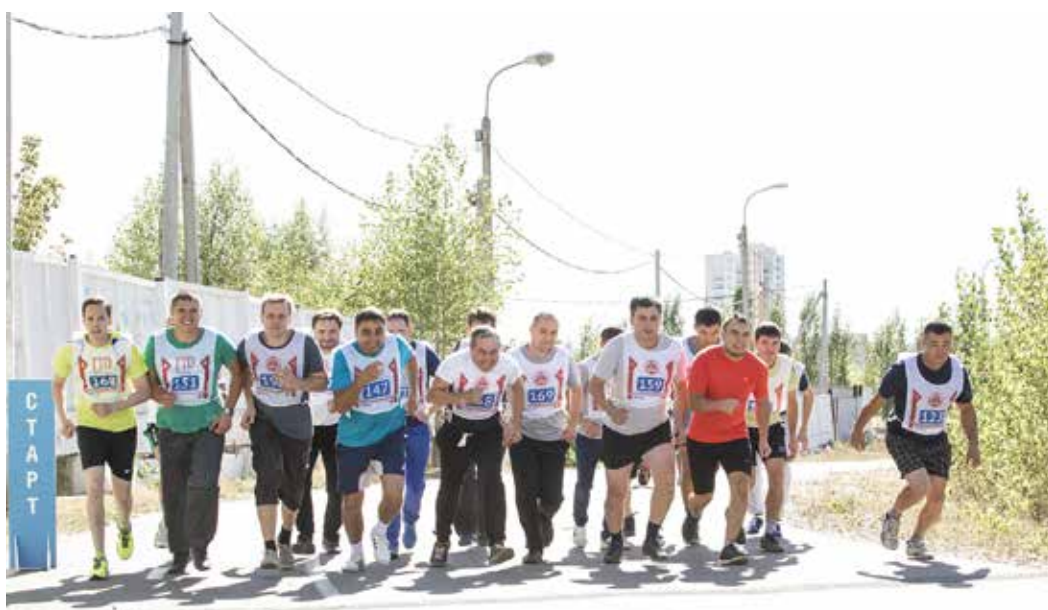
Выполнить спортивные нормативы изъявили желание 743 работника «Газпром трансгаз Уфа»