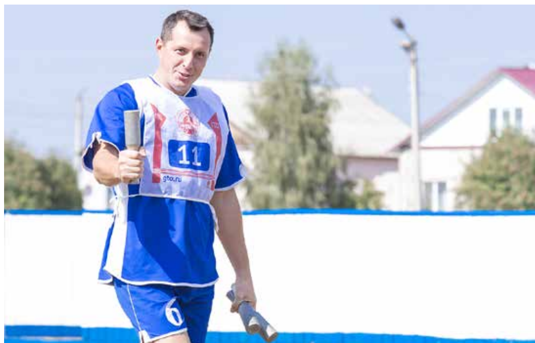
... и бросали гранату